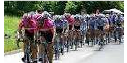
Prix cycliste de Saint-Philibert – 15 avril 2017

Comme d'habitude, depuis plusieurs années, le club cycliste de Trouhans organise le Prix cycliste de Saint-Philibert le samedi 15 avril 2017 après-midi. ATTENTION, pour des raisons de sécurité, nous vous demandons d'être vigilants et tolérants vis-à-vis des coureurs.